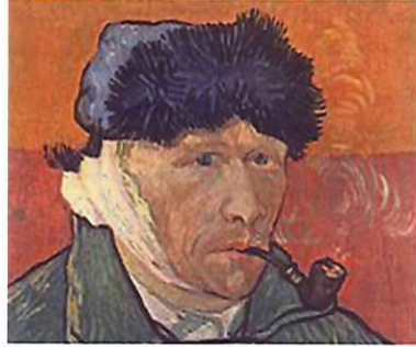
ゴッホ画「パイプを銜えた包帯の自画像」(1889年)

には、パイプを銜えた作品も数点存在している。中でも対照的な二枚の自画像があって、一枚は「パイプを銜えた麦藁帽子の自画像」で1888年の作品。もう一枚は翌年の「パイプを銜えた包帯の自画像」である。