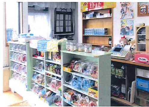
店の片隅にはたばこの陳列カウンターも

物に来てくださるお客様様用にと、得意の裁縫で手作りの手提げの買い物袋を作り、無料で差し上げており、その買い物