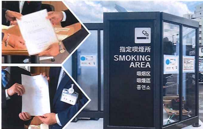
粘り強い要望活動の成果が喫煙所創出へ (写真はイメージです)

粘り強い要望活動の成果が喫煙所創出へ (写真はイメージです) 自治体への提出250件、議会への提出216件と大幅に増えて、それ以後も上昇した(別表参照)。 追い風 要望活動の背中を強く押したのがたばこ議員連盟の働きかけだ。令和2・3・4年度税制改正大綱に「屋外分煙施設等の整備の促進」が記載され、これを受けて総務省自治税務局事務連絡で同趣旨に沿った通知が全国の自治体に発出された。この通