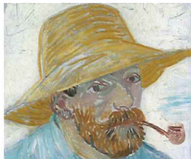
ゴッホ画「パイプを銜えた麦藁帽子の自画像」(1888年)

円)もの値が付き、1000年間で絵の価格が10万倍以上となっている。 そのゴッホだが、どこに行くにもパイプを離さなかったほどの愛煙家で、彼の自画像のなか