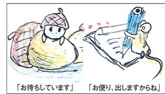
(イラスト:新潟県・星 ミユキさん)

●たばこ新聞は、今、一番頼りになる情報源になっています。ただ、私の店は、月2回の定期配達のため、新聞が届くのが月末になってしまい、POP講座のテーマなどは月遅れになってしまいます。できれば、テーマを1か月早めに掲載していただけるとうれしいのであります。