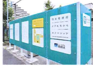
東京の防災喫煙所