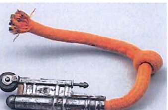
ヒューズライター(オイルを使わないライター)・アメリカ合衆国【ヒューズ】綿製のローブに硝石を混ぜたものを使ったライター。19世紀後半のヨーロッパで登場し、オイルライターが普及した後も、アウトドア用などで使われてきた。

ライターは、近代ヨーロッパで発明された喫煙用の着火具である。ライターの着火機構は、人類が古来より行ってきた「火打ち石」と火打ち金とで火花を起し、その火花を燃料に移して火を得る」という方法がもとになっている。 近代的なライターの開発は、1903年にカールウェルスバッハが、高効率の火打