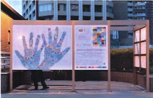
橋本駅の喫煙所の壁面アート

JTでは、相模原市SDGs推進室と「さがみはらSDGsパートナー」(橋本商店街協同組合)と生活介護事業所の2団体と協働した「橋本の街をキャンバスに! SDGsカラーアートプロジェクト」が昨年末に発足した。プロジェクトは、橋本エリアを中心にSDGsの認知拡大及び住民の街づくりに貢献するため、相模原市と包括連携協定を締結している多摩美術大学の協力のもと、グラフィックデザインを専攻する学生・大学院生に加え、地域住民が創作したアート作品が橋本エリア内の様々な場所に掲出され、SDGsを啓発の動機づけとなっている。