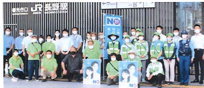
JR長野駅での街頭イベントに参加したみなさん

上信越連合会(三上健一会長)では、群馬県(JR高崎駅)、新潟県(JR新潟駅)、長野県(JR上田駅・長野駅)で、それぞれ20歳未満喫煙防止街頭イベントが展開された。このうち、長野県では、別掲のような街頭イベントを行うとともに、長野県立小海高校、同佐久平総合技術高校白田キャンパスと浅間キャンパス