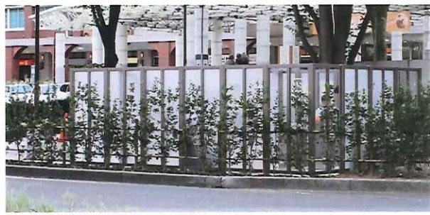
新設された福島駅東口の喫煙所