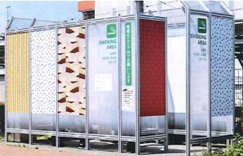
花小金井駅の公共喫煙所

JTは、(株)デザイン主催の「CIVIC PATTERNS PROJECT」に参加し、武蔵野美術大学及び小平市と協働して市内の花小金井駅・小平駅・新小平駅・橋本駅・小平駅4駅付近の既存公共喫煙所を地域の観光特産をモチーフに、同市に根差したグラフィックアートのデザインによるデザイン喫煙所にリニューアルした。供用開始は去る5月10日。リニューアルは「シビックプライド(住民に地域に対する愛情・誇り)の醸成を目指す」ことを目的に、壁面には武蔵野美術大学の学生が制作したグラフィックアートが施されている。デザインは、小平市と縁の深い丸ポスト、ブルーベリー、梨、糧うどん、玉川上水などの名所名産品をモチーフとしている。