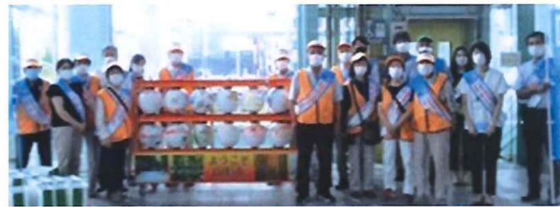
JR山形駅の街頭イベントに参加したみなさん