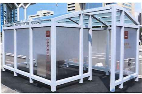
JR富山駅北口に設置された喫煙場所

JR富山駅では、駅中央出口に北陸新幹線の開業(2015年)から、円形のスマートな喫煙所が設置され、駅周辺の環境美化にも