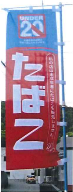
大いに目立つ幟(のぼり)旗

徳島県鳴門市で、「20歳未満喫煙防止」をアピールする幟(のぼり)旗を道路沿いの門の側に掲げ、さらに自販機の側の扉には「喫煙処」の幟旗を掲げ、地