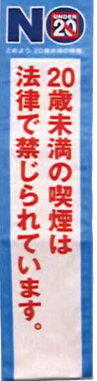
タスキ(片面)タテ750mm×横140mm

「未成年者喫煙禁止強化月間」などの名称を「20歳未満」に変更するとともに、全協では、このほが街頭イベントでは、「20歳未満喫煙禁止」表記のぼり旗やタスキを新たに作成し、各連合会に配付した。たばこ販売店は、新成年である18歳から19歳の来店者にも注視しつつ、「20歳未満に売らない、買わせない、吸わせない」ことの、より一層の徹底継続が必要となる。