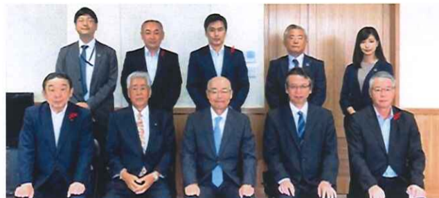
大分県たばこ販売連絡協議会関係者

大分県たばこ販売連絡協議会(高橋利会長・大分県組合専務理事)は10月14日、自民党大分県たばこ産業振興議員連盟(志村学会長・県議会議員)幹部、J-T大分支店(蔵下泰豊支店長)、大分県飲食業