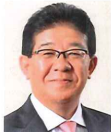
金子恭之 総務大臣