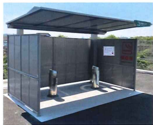
築上町役場敷地内に新設された喫煙所

進みました。 年が明けた2月に、理事長と事務局で、4自治体の市長、町長、市議会議員、町議会議員に対して怒涛の面談ラッシュを展開。 そして、こうした活動の結果、議員皆さんの尽力のお陰もあって、4自治体の議会へ陳情書を提出することができました。そして、本年