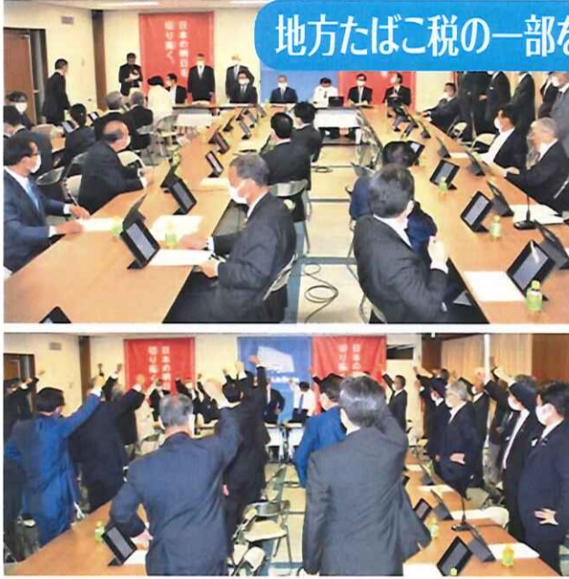
総会では決議文を可決(上)。声高らかに応援のシュプレヒコール(下)

我が自由民主党たばこ議員連盟は、昨今のたばこを取り巻く厳しい現状をしっかりと受け止め、今後の活動計画目標は次の通りとする。 ● 地方たばこ税の部を「分煙環境整備へ活用する全国的制度化」を目指す。 ● 本要望趣旨の「令和4年度税制改正大綱へのより具体的記載」に向けて努力する。 ● 総務省への協力依頼を継続し、「分煙環境の整備」に対して積極的に地方たばこ税の活用を図る等の自治体事務局通知及び全国市長会等での同趣旨の継続的発言」を目指す。