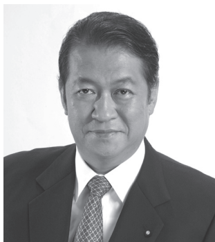
一般財団法人 日本友愛協会