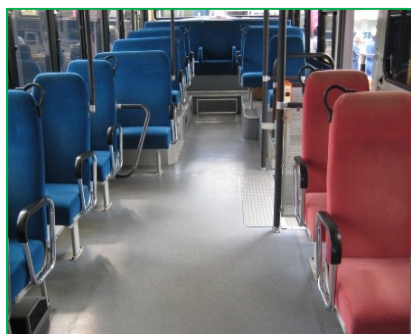
ノンステップバス(床段差は2段)