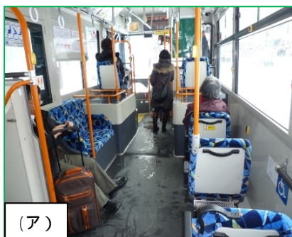
<<荷物置きとして活用(一番前の席)>>