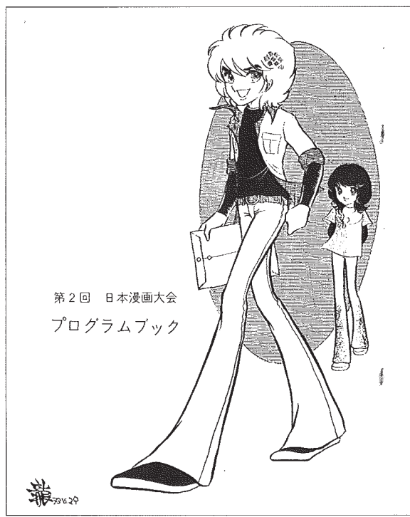
第2回 日本漫画大会 プログラムブック

67年に創刊された『COM』（虫プロ商事）は、手塚治虫の「火の鳥」、石森章太郎の「ジュン」など新たなマンガの可能性を求める作品の連載を行ったマニア誌のハシリではあるが、それ以上にマンガ家予備軍やマニアたちを掴みえた要因は「ぐらこん」（グランドコンパニオン）というコーナーだった。そこには新人の投稿マンガが採点表付で掲載され、「自己表現」という形での実験マンガや青年マンガが若い世代の表現者によって次々と発表されていった。岡田史子、宮谷一彦、長谷川法世、青柳裕介……。それは60年代末という時代の中で、マンガを自覚的に自分たちの表現として捉えさせることになっていった。同時に、ここでは仲間たちよ集まれと呼びかけ、マンガ同人誌を作ること呼びかけていったのだ。『COM』を通して、67～70