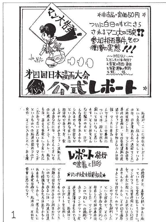
第4回 日本漫画大会秘公式レポート 1976年7月発行