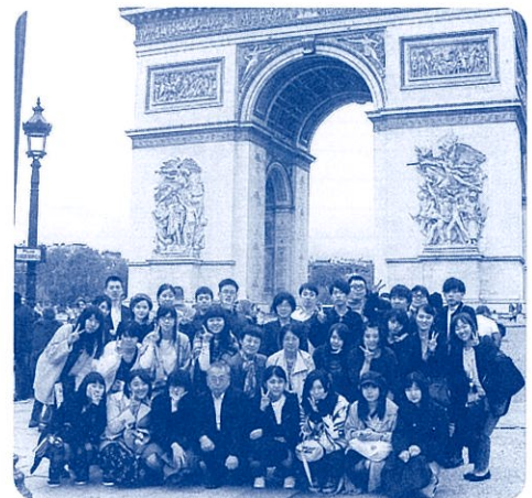
第14回海外研修旅行 「凱旋門前にて」(専攻科)