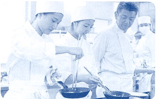
調理実習「西洋料理」(専攻科)