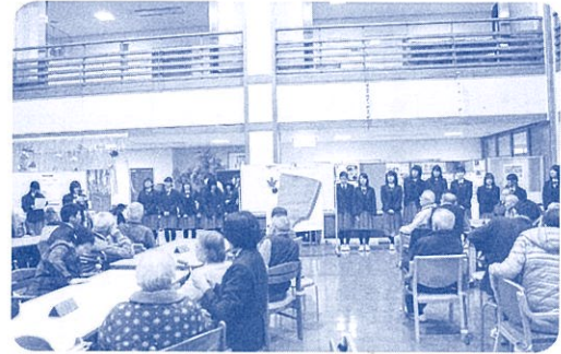
特別養護老人ホーム「白光苑」訪問活動 (昼間単位制)

* 指定の木曜日 14:20 ~ 16:05 に定通併修スクーリングを受けることができる。 * 他部・他課程の授業を受けることができる。