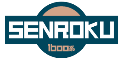
乗車券裏面イメージ