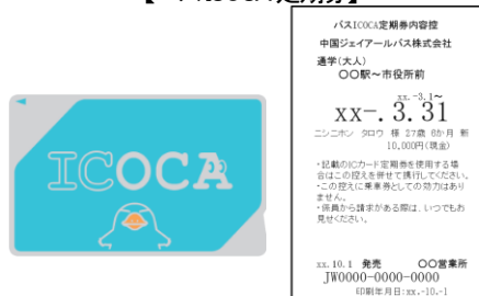
<バスICOCA 定期券内容控>