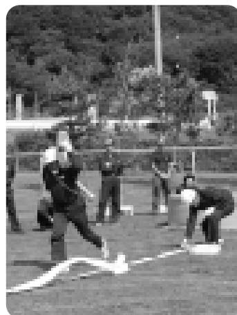
消防訓練に励む団員