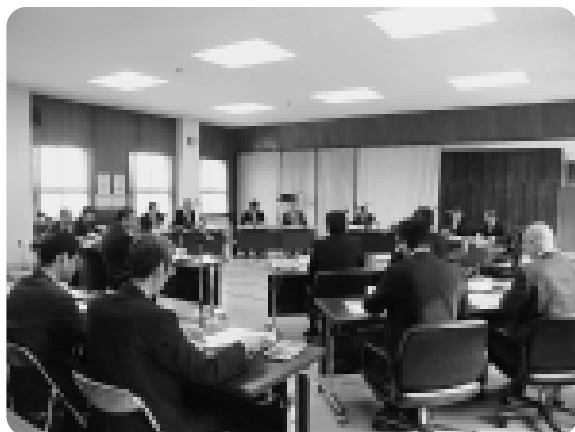
議案を審議する議会のような