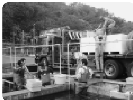
サケ稚魚の出荷作業