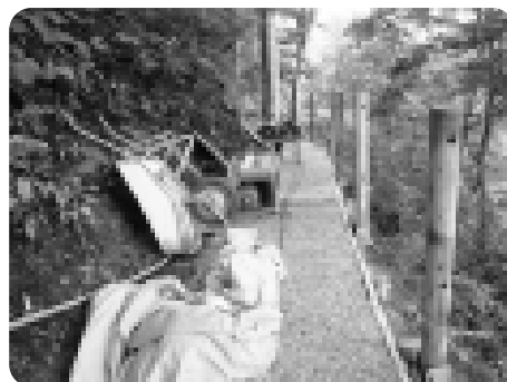
整備中の賀老の滝遊歩道