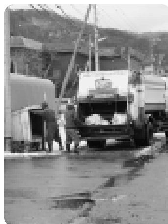
家庭のゴミを収集