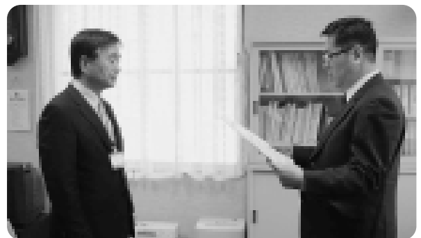
後志支庁環境生活課長から教育長へ伝達

3月31日現在、村内の交通事故死ゼロは1690日を更新中ですが、村外でも交通ルールやマナーを遵守し、村民の交通安全に取り組む姿勢が高く評価されています。