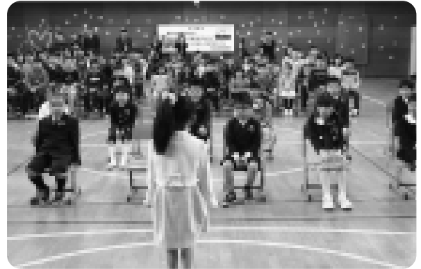
上手にあいさつする新入生

1日には保育所で入園式が、7日には中学校で13人が出席して入学式が行われました。