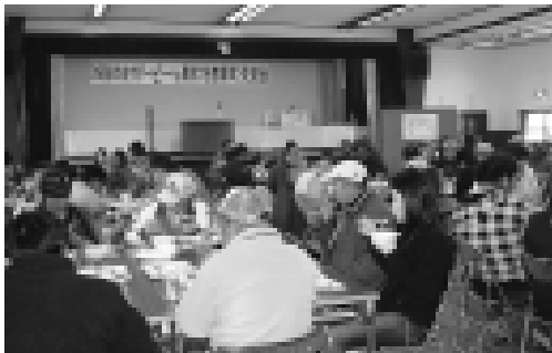
盛り上がった交流会