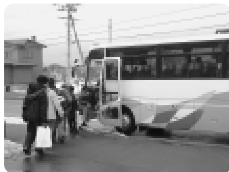
スクールバスで通学する小学生