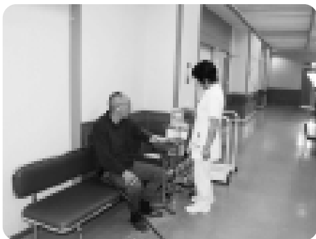
血圧を測定・・・診療所