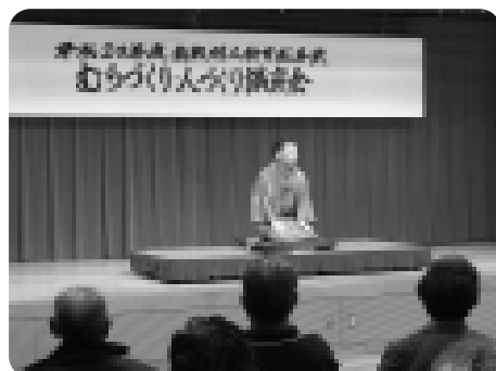
人材育成事業の講演会