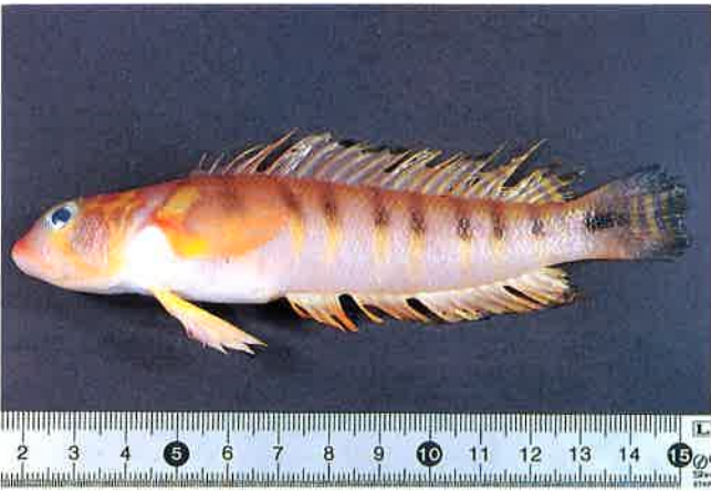
2. オキトラギス (TL18.4cm) P12&52