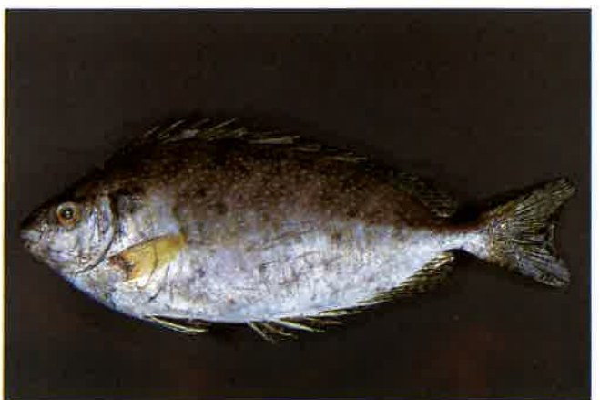
8. アイゴ (TL20cm) P12& 51