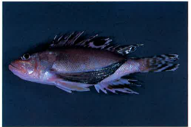
7. ハチ (TL14cm) P14&58