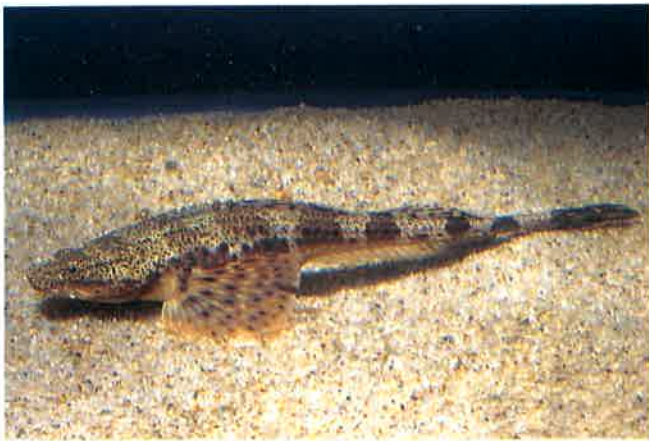
1. シロウ (TL19cm) P15& 62