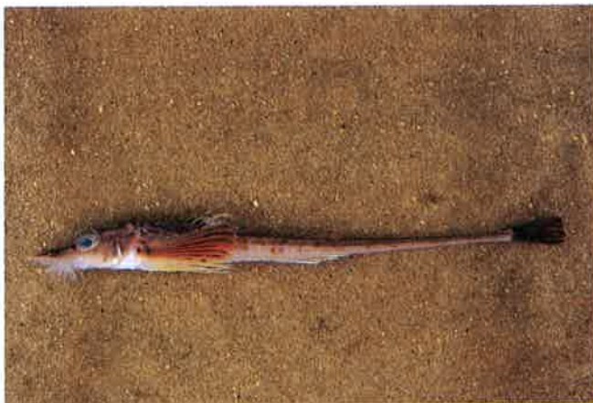
2. テングトクビレ (TL18.8cm) P15& 63