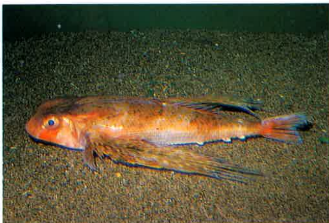
3. ホシセミハウボウ (TL32cm) P15& 64