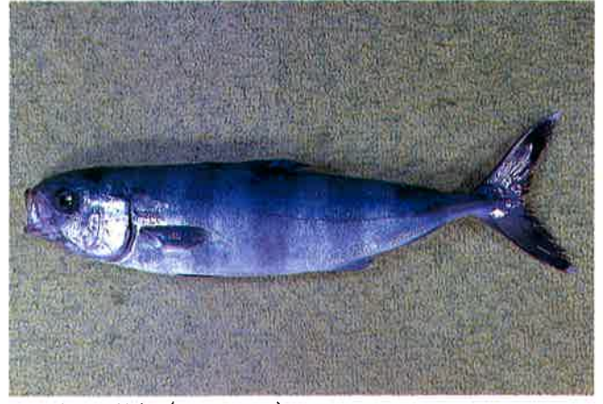
5. ブリモドキ (TL32.5cm) P 8 & 38