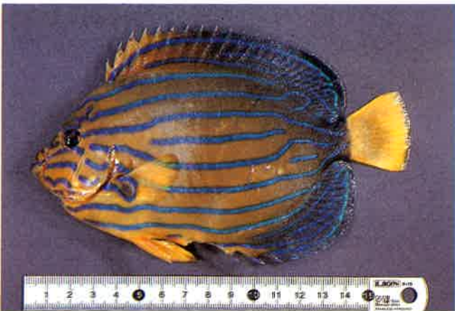
2. キンチャクダイ (TL16.5cm) P10& 46