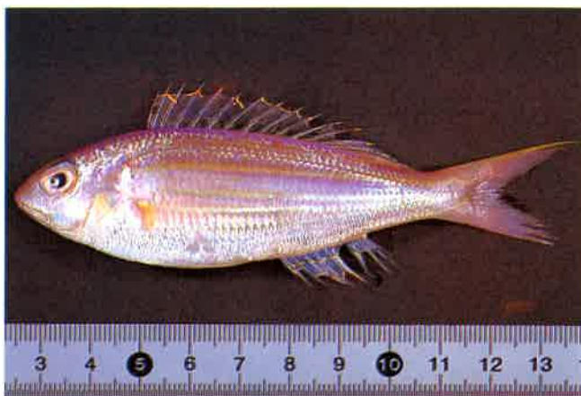
6. イトヨリダイ (TL12cm) P10& 42