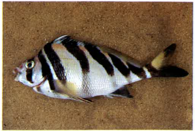
5. ユウダチタカノハ (TL20.5cm) P10& 48