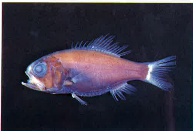
4. ハリダシエビス (TL8.7cm) P 6 & 28