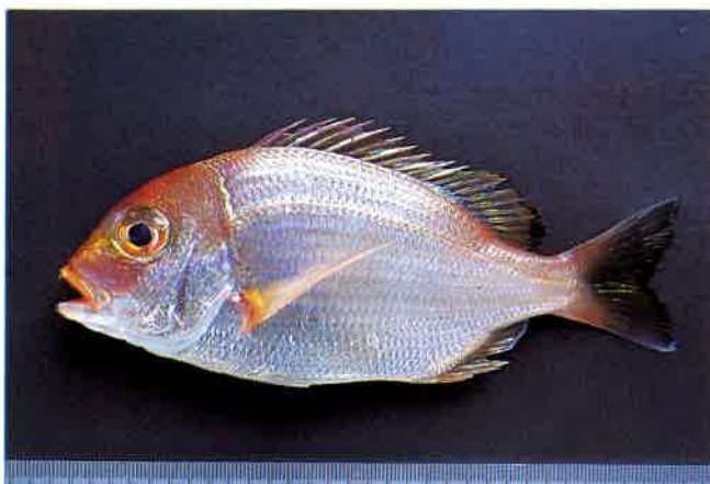
7. キダイ (TL16cm) P10& 43