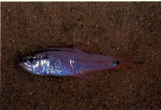
4. ネンブツダイ (TL6.5cm) P 8 & 37