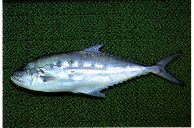
6. オオクチチカツオ (TL65cm) P 8 & 38