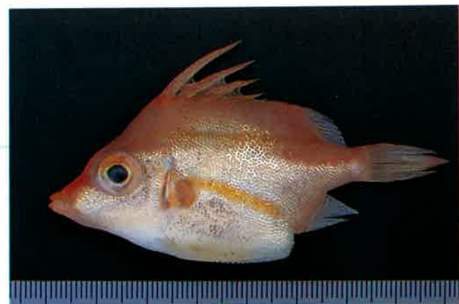
8. ベニカワムキ (TL18cm) P17& 72