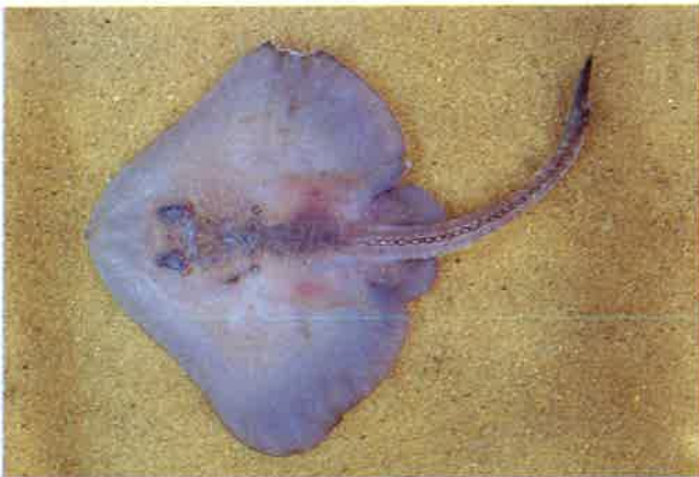
3. ドブカスベ (TL22.8cm) P 3 & 22