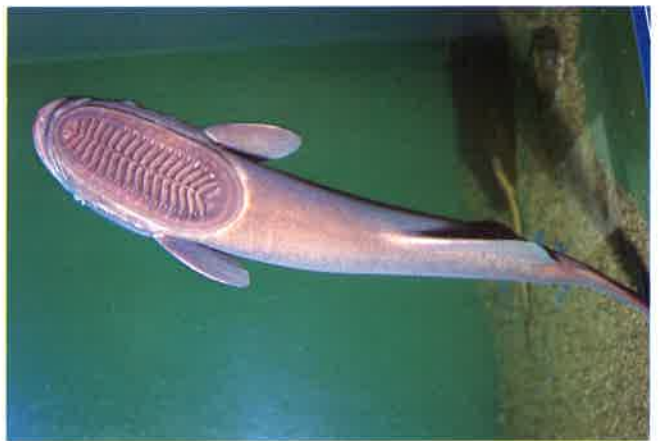
7. ナガコバン (TL65cm) P11& 50