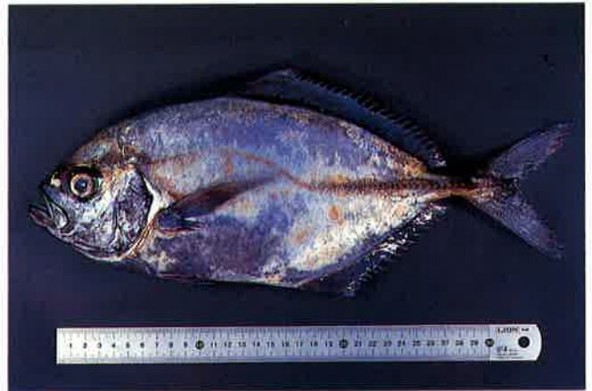
8. オキアジ (TL35.5cm) P 8 & 39