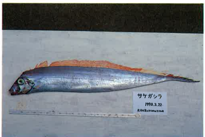
8. サケガシラ (TL157cm) P 7 & 33