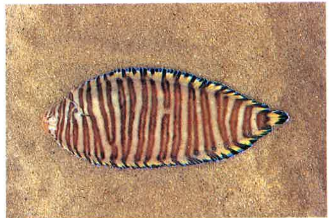
6. セトウシノシタ (TL15.5cm) P16& 72