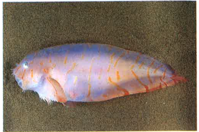
5. アバチャン (TL20cm) P15& 71