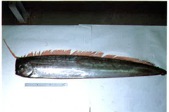
6. アカナマダ (TL122.5cm) P 7 & 32