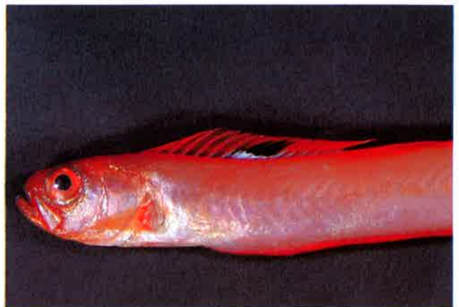
6. イッテンアカタチ (TL24.5cm) P11& 49