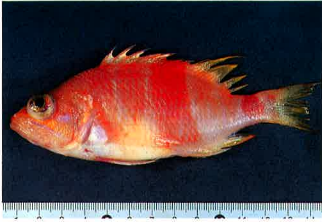
1. アズマハナダイ (TL13.5cm) P 8 & 34