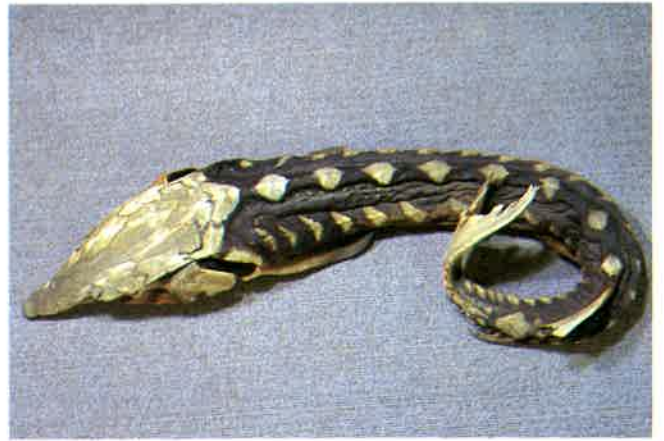
5. チョウザメ (TL125cm) P 3 & 23