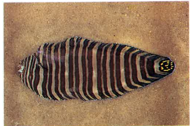
7. シマウシノシタ (TL25cm) P16& 72