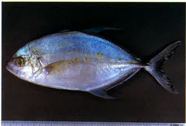
1. ナンヨウカイワリ (TL30cm) P 9 & 39