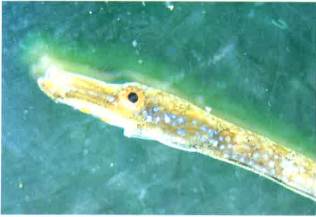
1. オクヨウジ (TL8.1cm) P 5 & 26