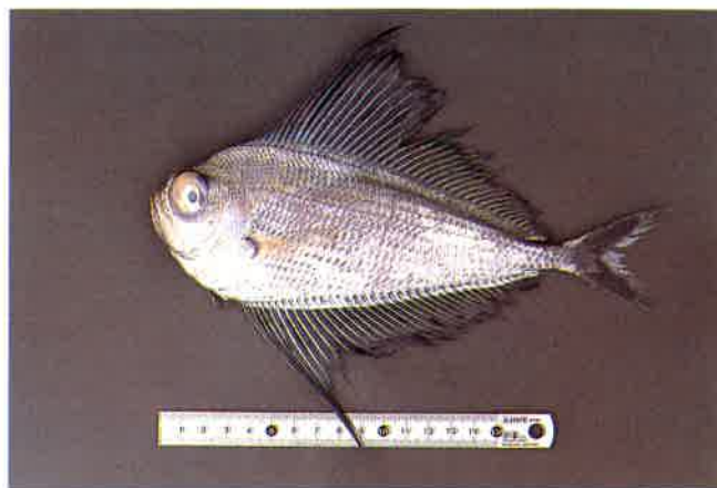
5. リュウグウノヒメ (TL23cm) P 9 & 40