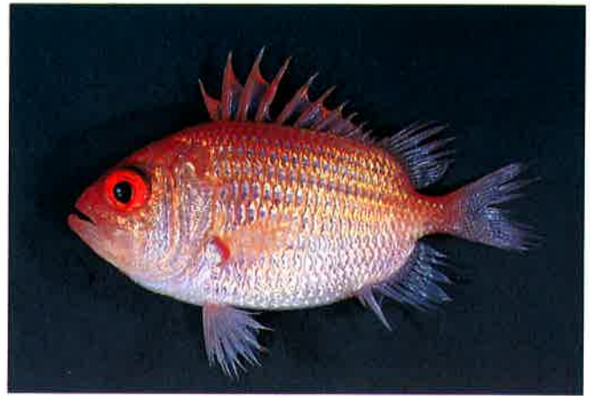
5. エビスダイ (TL10cm) P 7 & 31