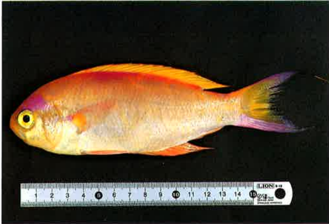
2. シキシマハナダイ (TL23cm) P 8 & 35