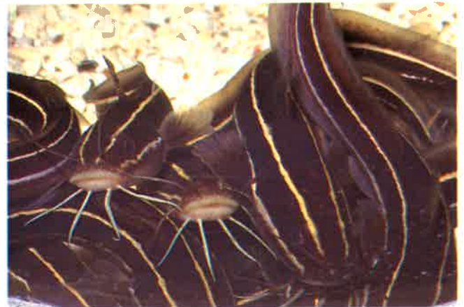
6. ゴンズイ (TL11~15cm) P 4 & 25