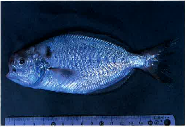
1. イボダイ (TL17cm) P12&51