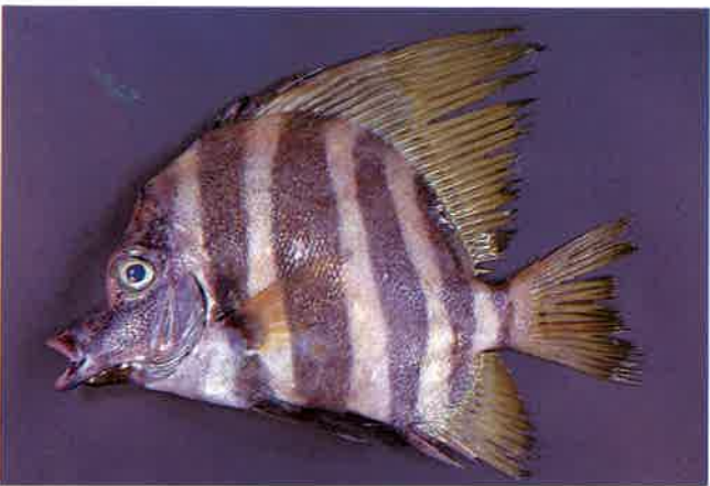
3. テングダイ (TL28cm) P10& 46