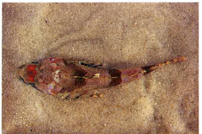
8. アイカジカ (TL19cm) P15&61