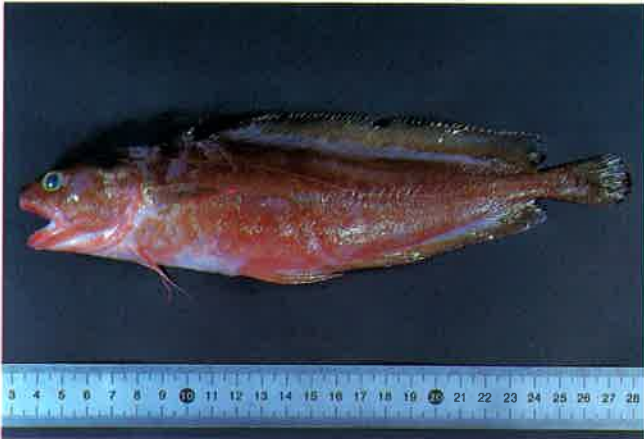
2. イソアイナメ (TL24cm) P 6 & 27