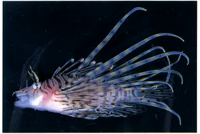
6. ハナミノカサゴ (TL11cm) P14&57