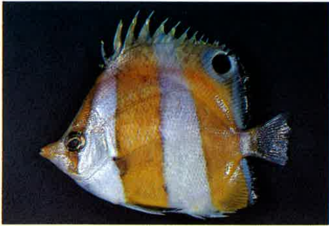
1. ゲンロクダイ (TL10.2cm) P10& 45