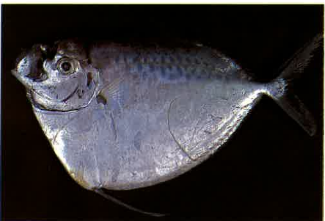
3. ギンカガミ (TL21.5cm) P 9 & 39