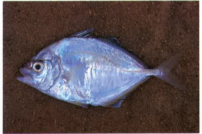
7. カイワリ (TL14cm) P 8 & 39