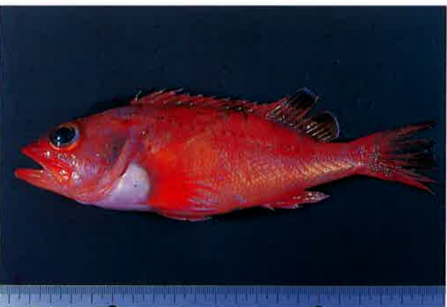
4. ユメカサゴ (TL20cm) P14&57