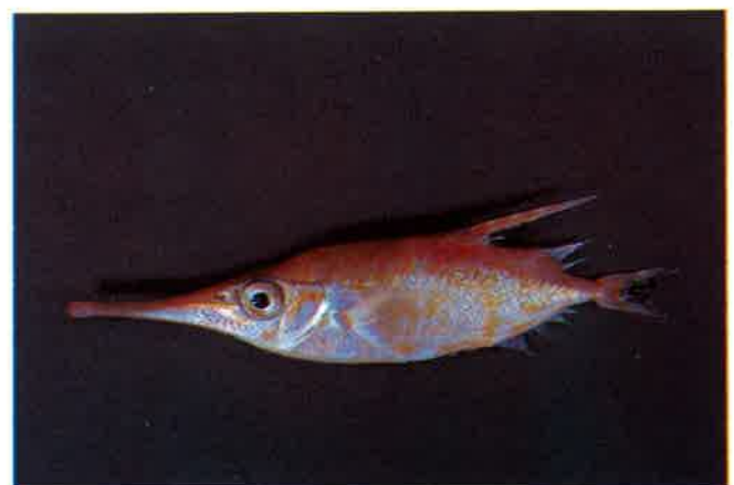
8. サギフエ (TL11.5cm) P 5 & 26