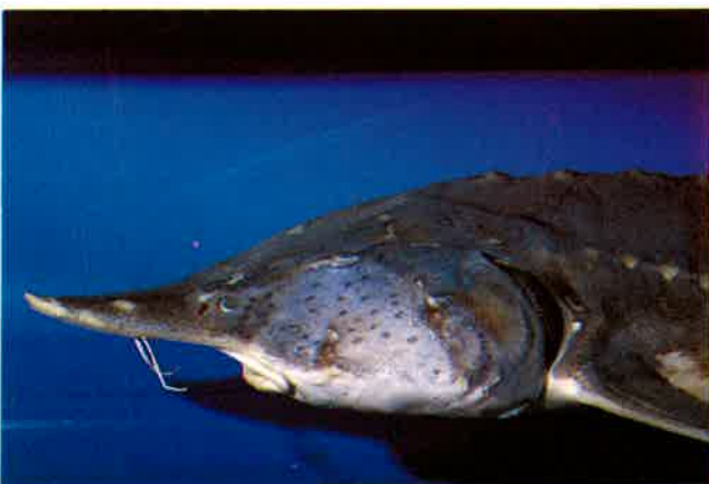
4. ダウリアチョウザメ (TL135cm) P 3 & 23