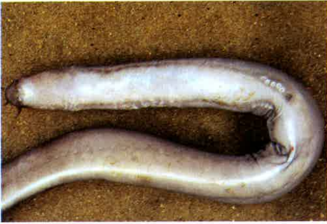
1. ヌタウナギ (TL42cm) P 2 & 19