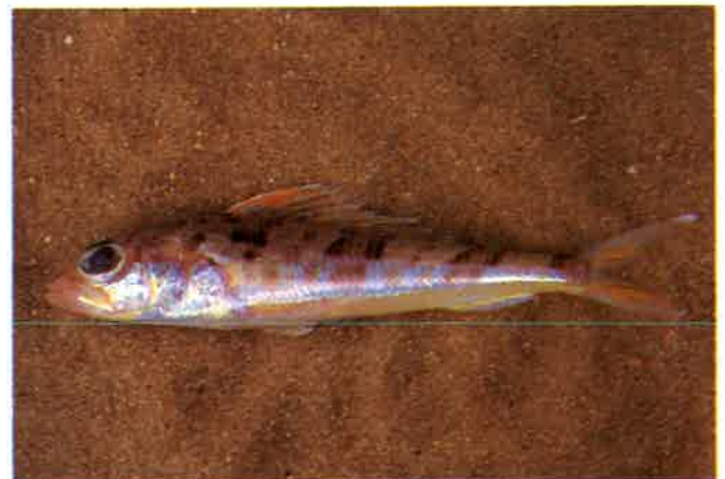
7. ヒメ (TL16cm) P 5 & 25