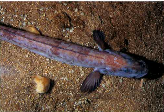
3. ネズミギンポ (TL35cm) P13&54