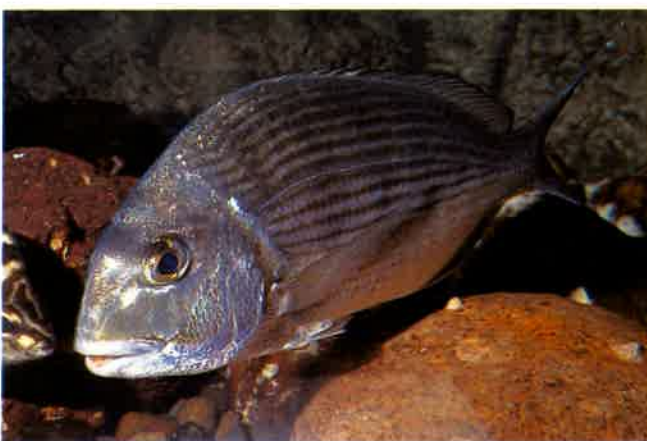
8. ヘダイ (TL27cm) P10& 43