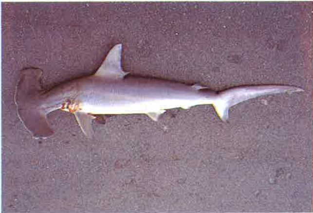
2. アカシュモクザメ (TL118cm) P 2 & 21