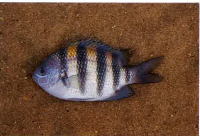
4. オヤビッチャ (TL10cm) P10& 47