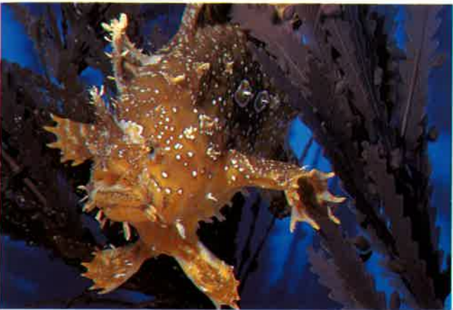
3. ハナオコゼ (TL13cm) P 6 & 28