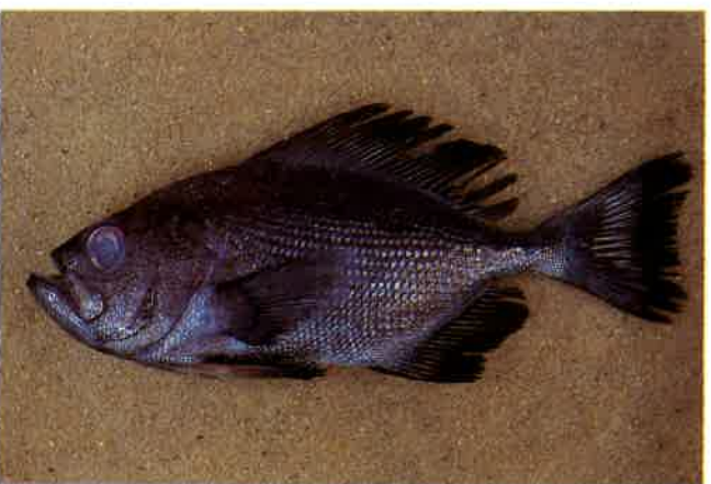
4. ツルギエチオピア (TL19cm) P 9 & 40