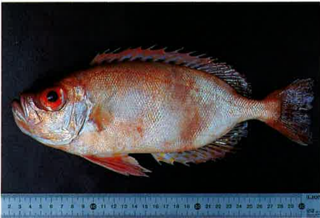
3. キントキダイ (TL29cm) P 8 & 36