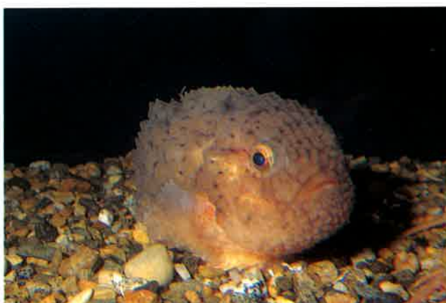
4. コンペイトウ (TL12cm) P15& 64