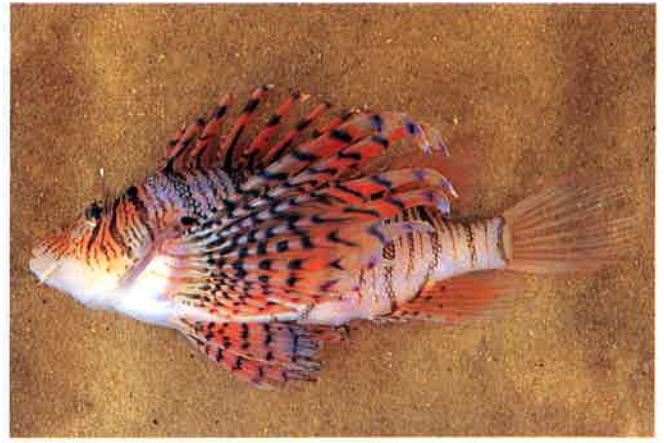
5. ミノカサゴ (TL27cm) P14&57