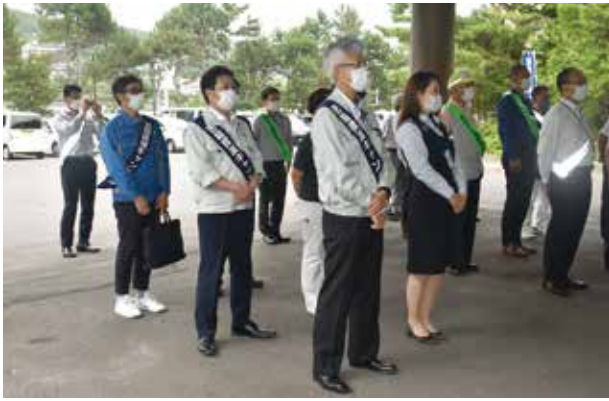
参加の通関士の皆さん