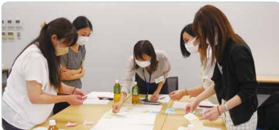
提出された意見を取りまとめています