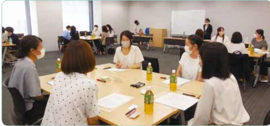
テーマに沿って討議中です