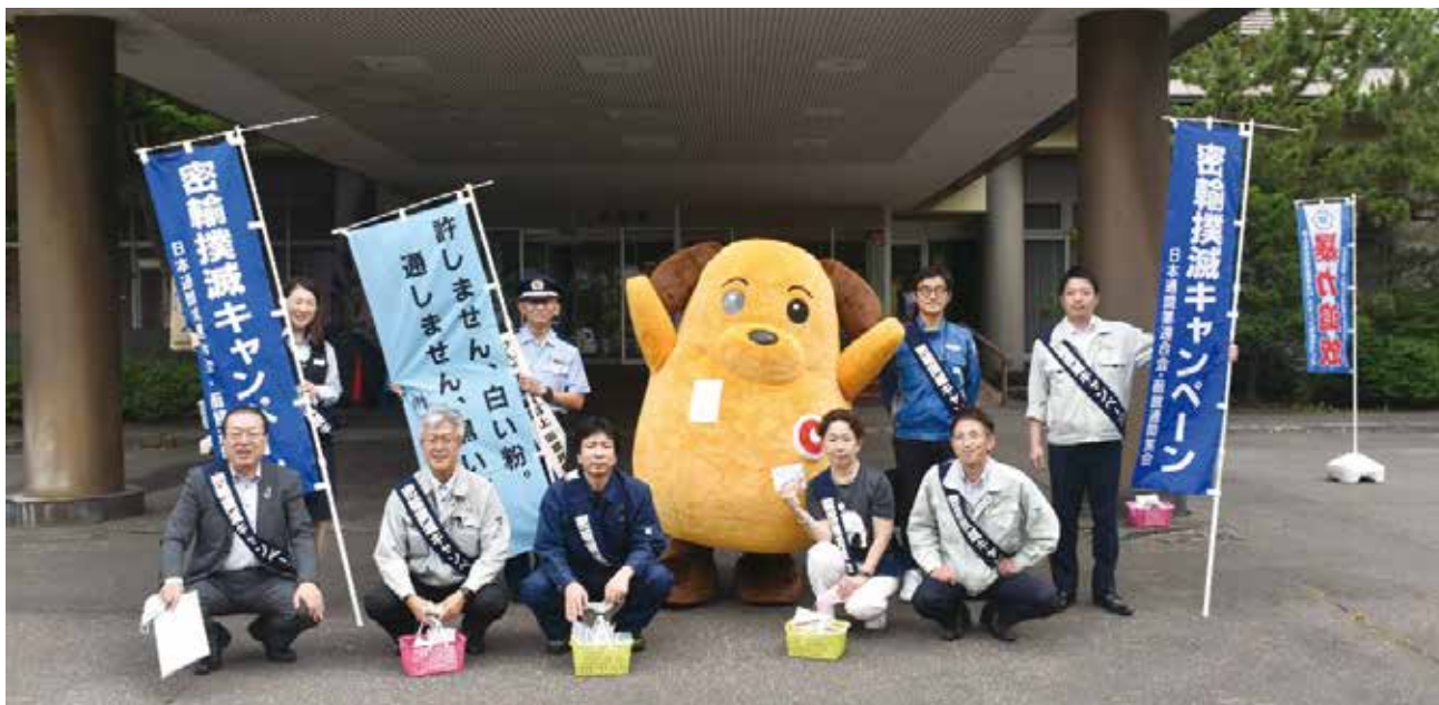
密輸撲滅キャンペーンに参加した室蘭通関業者協議会メンバー

函館通関業会は、8月4日(木)に「密輸撲滅キャンペーン」を室蘭市において実施しました。室蘭市の実施する「夏の暴力追放運動の啓発活動」への協賛・共催として、室蘭税関支署と合同で密輸撲滅キャンペーンを実施しました。