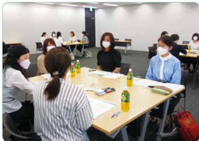
グループによる意見交換会の様子です