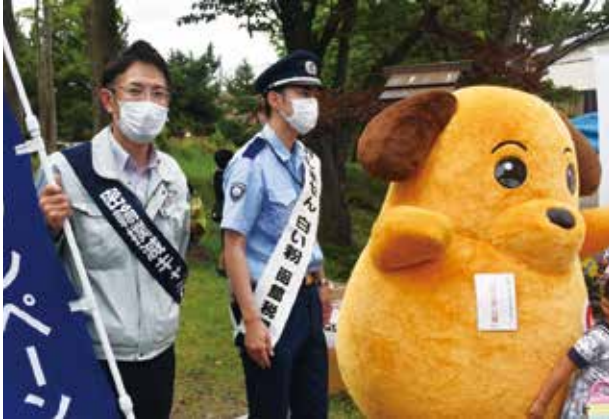
室蘭通関業者協議会 横山事務局長（左）