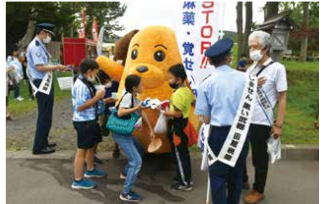
子供に囲まれ大人気