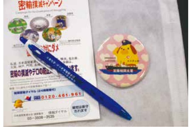
配布したキャンペーングッズ、缶バッジ