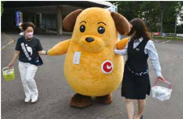
カスタム君の ハンドラー？