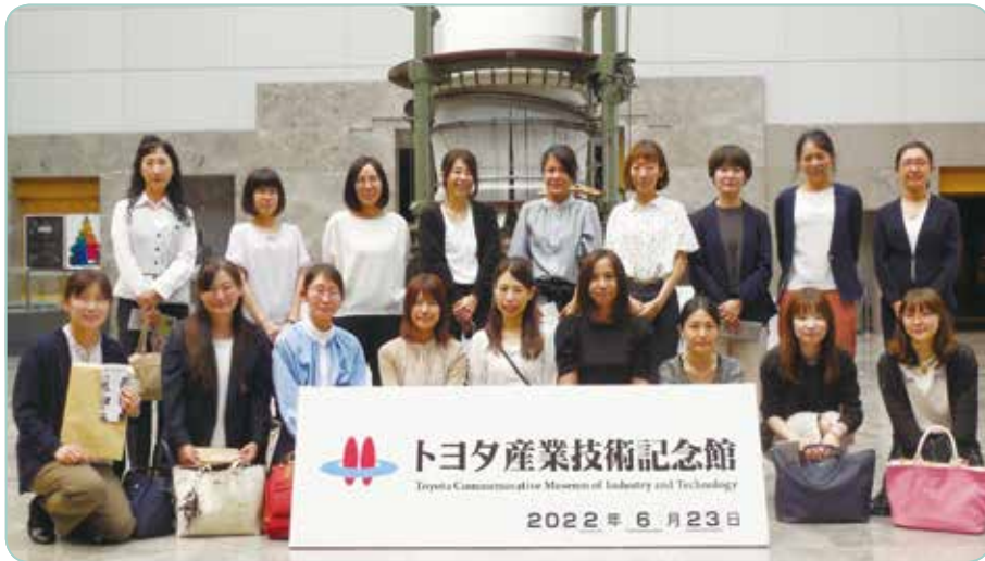
午後の部 見学会（トヨタ産業技術記念館）