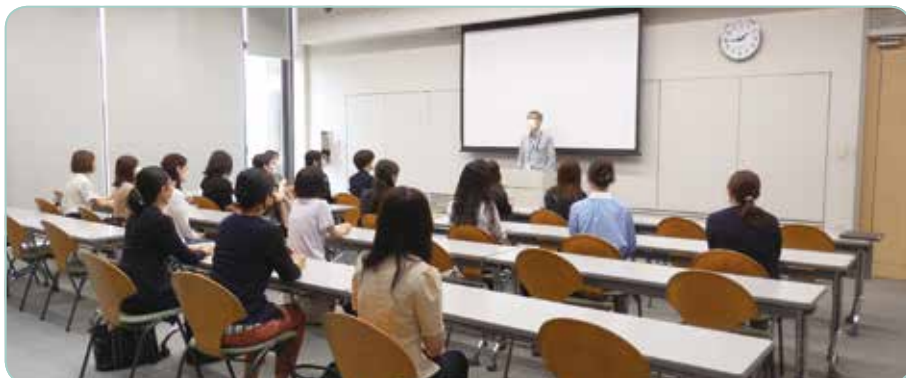
概要説明（館内ホールにて）