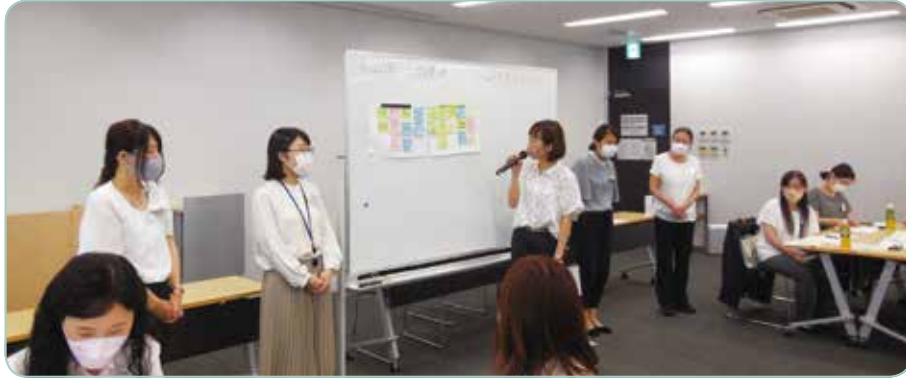
グループ発表の様子です