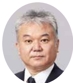
関税局長 すわ ぞの けんじ 諏訪園 健司