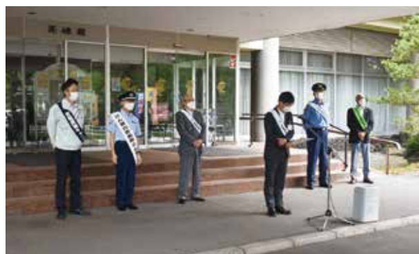
出陣式で挨拶をする室蘭市市長

会員も積極的に協力を呼びかけ、用意したキャンペーングッズは約30分で配布を終了し、大成功で終わりました。