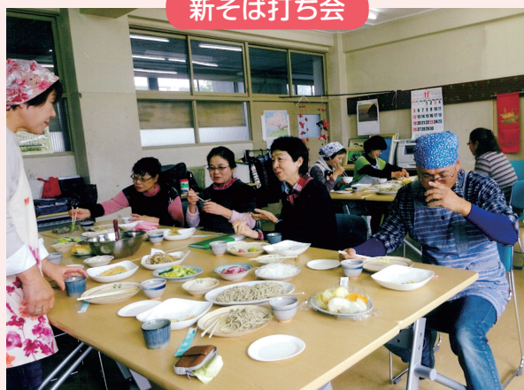
新そばは味も香りも最高 (^_^)