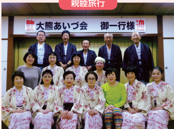
楽しかった～ 鬼怒川温泉ホテル三日月 みかづき