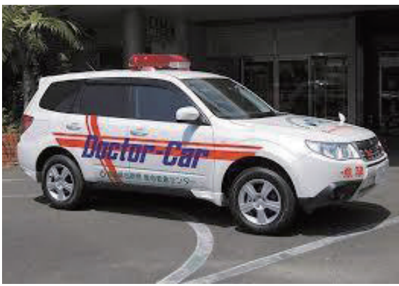
在宅医療に期待できる（イメージ）

答 在宅医療、訪問看護など双葉郡の広域地域医療支援の一環として富岡町に設置する県立医療センターに医師を送迎する福祉車両を