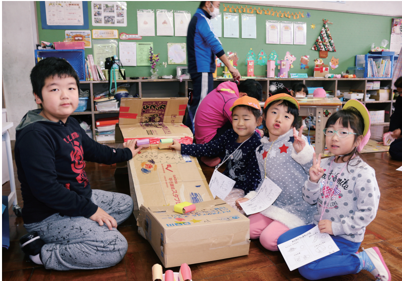
学校再開は可能か…