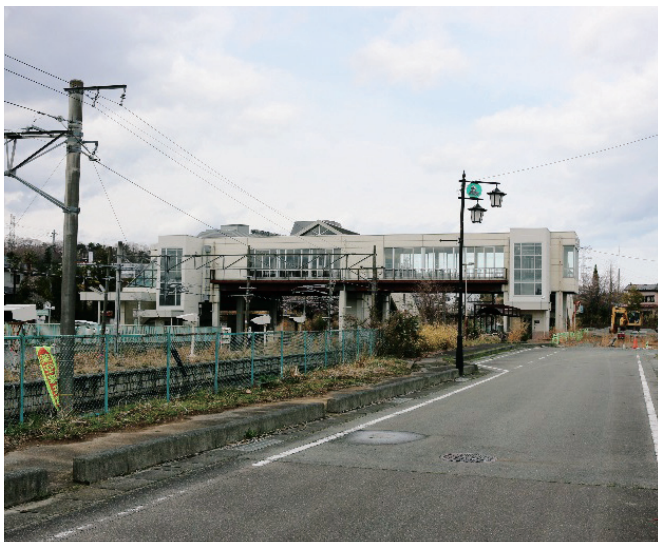
町の玄関口 全面改修が望まれる

一般会計補正予算では大野駅改修事業、県立病院へ福祉車両を配備するための予算などが計上されました。