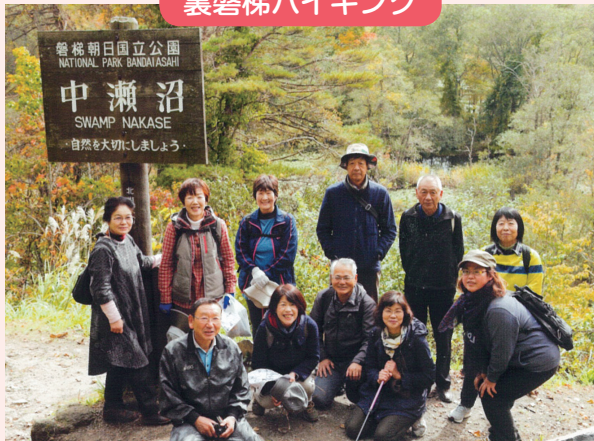
心も体もリフレッシュ

おおくま町会津会は、会津若松出張所内「おおくまサロンゆっくりすっぺ」を活動拠点とし、毎月第1・第3水曜日が開催日です。