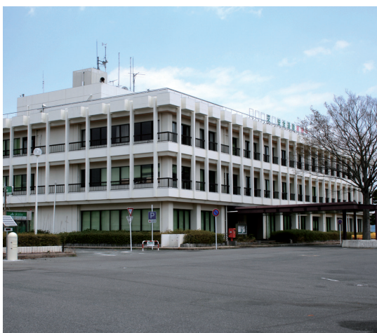
見た目はしっかりしているが…

平成29年11月27日会津若松出張所において委員会を開催し総務課、企画調整課、税務課出納室、教育総務課へ今年度の重点施策取り組み状況を調査しました。 主な質疑内容を報告します。