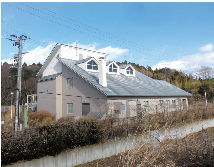
下水道は生活にかかせない（新町浄化センター）

(7) 業務内容を精査した上で、教育委員会の監督管理の下に、委託に適した業務は積極的に委託しながら効率よく進めていきたい。