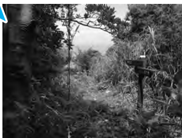
すっきりして歩きやすくなりました。

町の西南海岸沿いには「南伊豆歩道」が整備されています。梅雨時ともなると訪れる人が少ない歩道は、雑草が胸の高さまで伸びており、ジャングル状態。特にアザミは、道標を隠すまで育ち、固くて鋭い棘はズボンをはいていてもチクチクと痛みます。何より見た目がこわい。