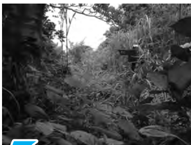
草木が生い茂っていた歩道も・・・