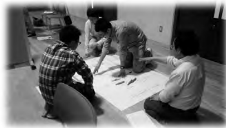
ワークショップでは、参加者がそれぞれの思いや意見を出し合い、提案発表を行いました