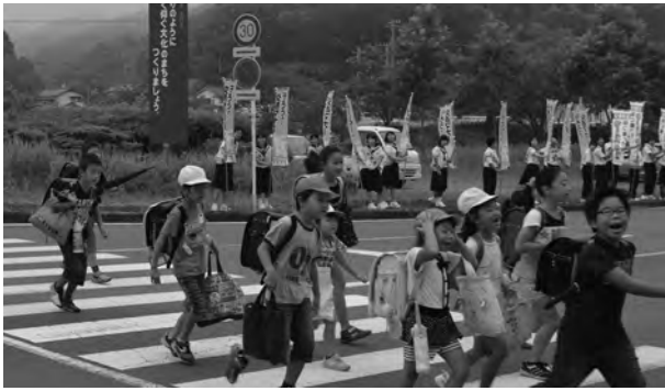
元気よく横断歩道を渡る児童たち

夏の交通安全県民運動の一環として、街頭指導が行われました。前原橋交差点では、南伊豆中学校生徒が旗を持ち、登校する児童生徒やドライバーに交通安全を呼びかけました。