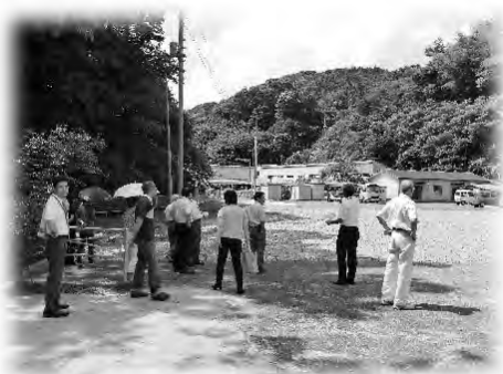
建設候補地の視察の様子