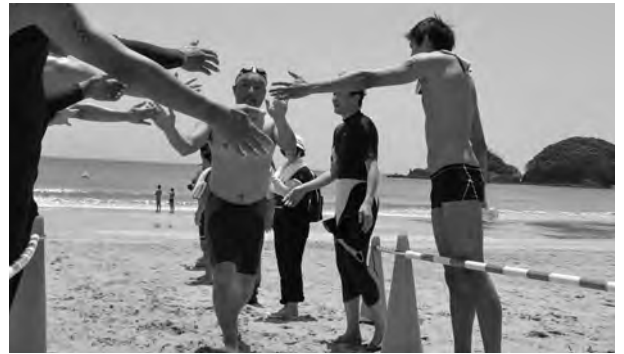
ゴールする選手を迎える参加者や応援者たち

第1回南伊豆・弓ヶ浜オープンウォータースイム大会が弓ヶ浜海水浴場で開催されました。全国から65人の選手が参加し、白熱したレースが繰り広げられました。9月には同海水浴場で国際大会が開催される予定です。