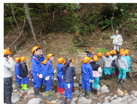
校外学習(地域を知ろう)