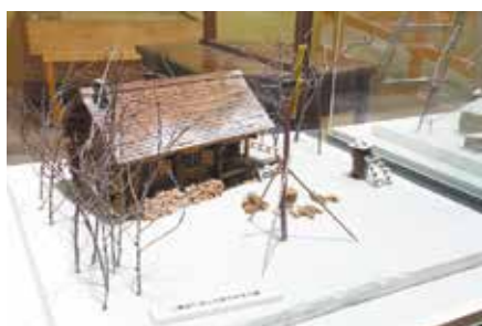
『北の国から』丸太小屋 模型