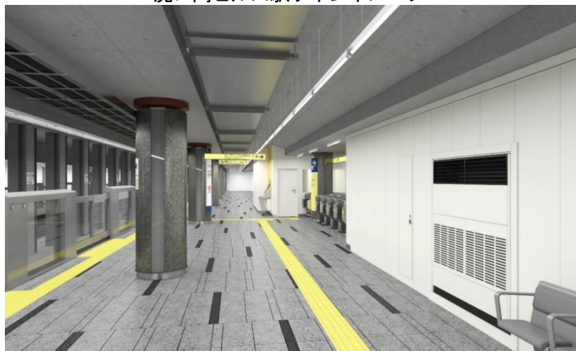
開業時北千住方面行きホームイメージ