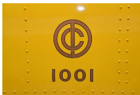
東京地下鉄道社紋