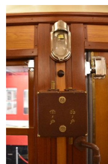
予備灯とドア開閉スイッチ