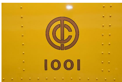
東京地下鉄道社紋と車番