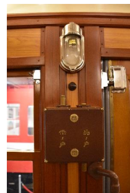
予備灯とドア開閉スイッチ