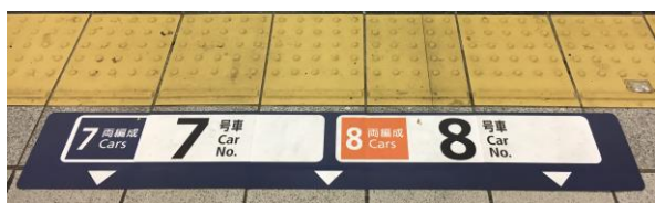
乗車位置ステッカー

新型と従来の車両では車両数やドアの位置が異なるため、新たな整列乗車の位置にステッカーを貼付しています。さらにご利用のお客様には列車の両数を行先案内表示器及び構内アナウンスでご案内いたします。2020年度中にすべての車両が置き替わるまで、ご利用のお客様にはご不便ご迷惑おかけいたしますが、整列乗車にご協力いただきますようお願いいたします。