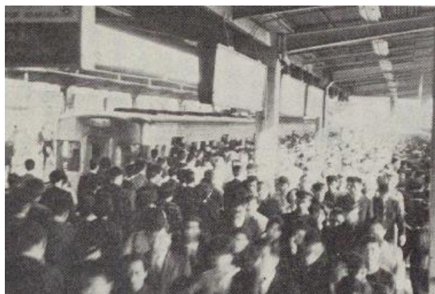
朝ラッシュで混雑する日比谷線北千住駅(1964年)

以降、外部有識者を交え、発生した熱の処理方法など地下鉄全体の空調計画の調査・研究を進めていきました。