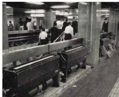
床にファンコイルユニットを設置した日本橋駅(1971年)