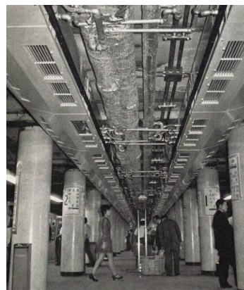
天井にファンコイルユニットが二列並ぶ銀座駅(1971年)