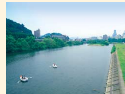
20年ぶりに復活した貸しボート。涼しい風が川面を渡る。