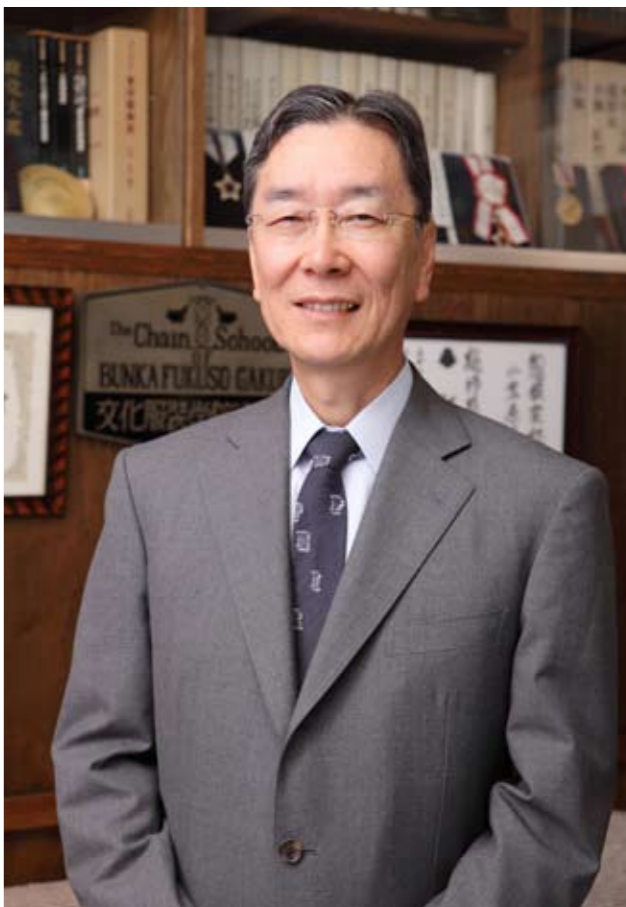
宮城文化服装専門学校校長

何十年、何百年と続いている企業はみな変革につぐ変革、改革につぐ改革で伝統を作り続けている。変えてはならない