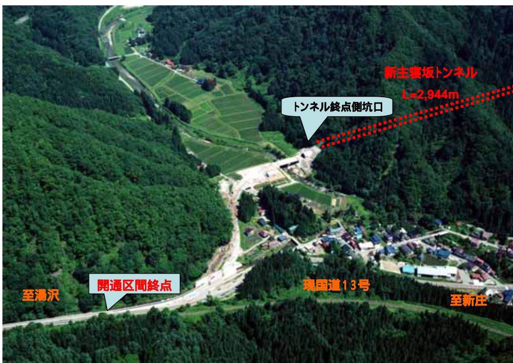
真室川町大字及位の開通区間終点部 (平成17年8月撮影)