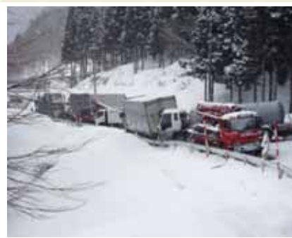
現道の線形不良箇所