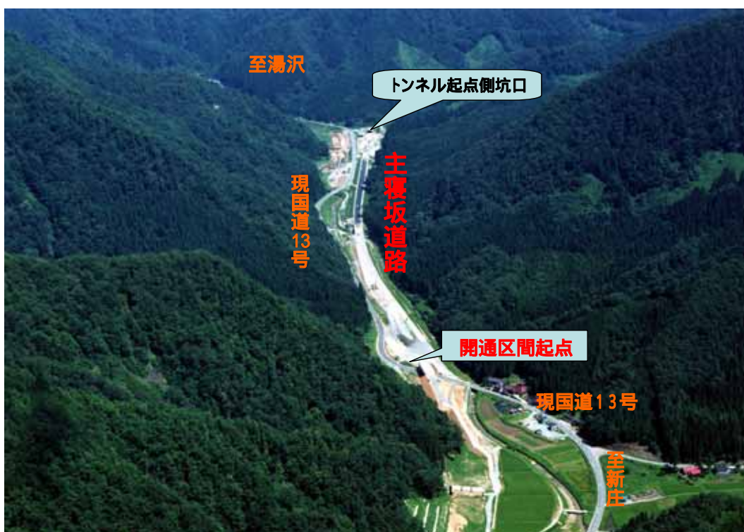
金山町大字中田の開通区間起点側より新主寝坂トンネル方面を望む (平成17年8月撮影)