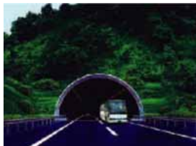
整備イメージ(新主寝坂トンネル)