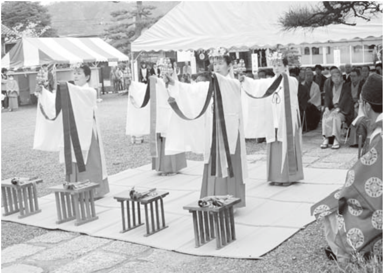
蚕織神社祈願祭にて

発行所 丹後織物工業組合 京都府京丹後市大宮町河辺3188 TEL0772-68-5211 FAX0772-68-5300 http://www.tanko.or.jp