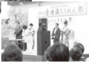
京丹後ちりめん祭

京丹後市の春を彩る恒例行事「第64回京丹後ちりめん祭」（同祭実行委員会主催）が4月12日、13日にアミティ丹後（網野町網野）周辺にて、また13日には「京丹後きもの祭」（京丹後市商工会主催）が網野神社周辺にて開催されました。 京丹後ちりめん祭では、13日に呉楽市（きものや帯等の展示即売会）や織物の展示、14日はこれらに加え、丹後うまいもん市、ちりめん小唄踊りなどの屋外イベントのほかに、屋内ではきものファッションショーや力織機の実演など多彩なイベントが行われました。 また、京丹後きもの祭では、網野神社境内にて静の舞や丹後小町踊り子隊の踊りなどのステージショーが行われたほか、手作り体験コーナーやきものフォトカレンダーサービスなどが行われました。