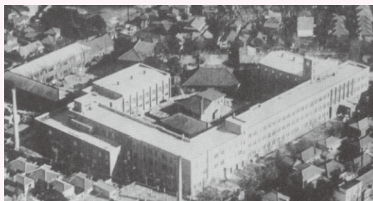
⑤完成直後の鉄筋校舎