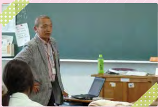
プロジェクトマネージャー