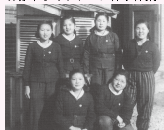
⑦文部省制定の「新制服」