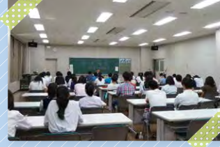
留学と海外への就職