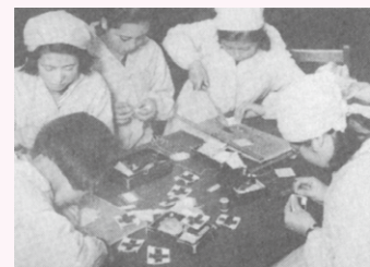
⑥赤十字のワッペン作り作業