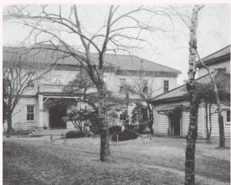
①創立当初の本館正面

戦後、都立第二高等女学校と改称され、3年制の都立竹早高校と年齢別に机を並べた。高女で入学した生徒には、高女、高校どちらの卒業証書を手にするか選択できたという。最後の府立第二高女、49回生を選択した卒業生の数は27名であった。