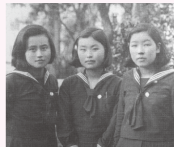
④セーラー服の制服