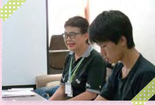
保険代理店とブランチ