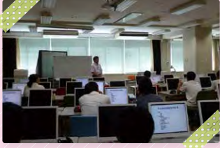
企業研究・開発者