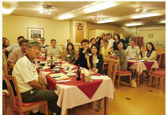
部活幹事連絡会の模様

また、新しい企画として、3月13日に高校67回生(2015年卒)の方々による座談会を開催し、未来や夢を思い切り語って頂きました。