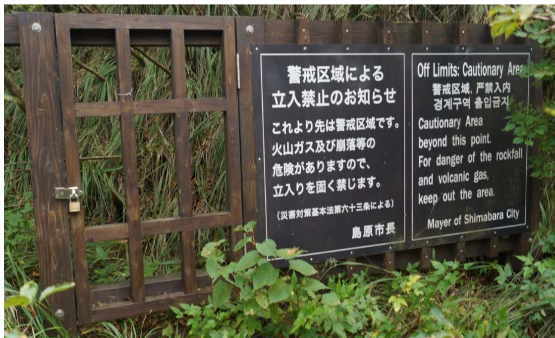
図表 2.4-(1)-⑥ 「警戒区域」の看板