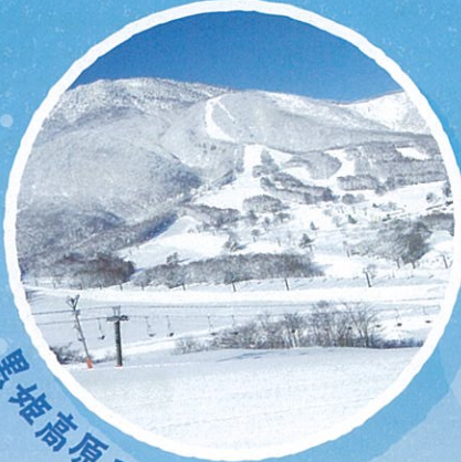
黒姫高原スノーパーク