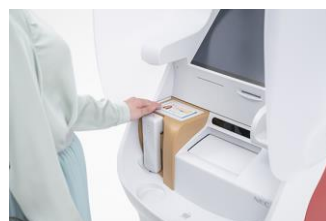
本人確認書類の読み取り

（注）NECの世界No.1の認証精度 ※1 の顔認証技術で、迅速かつセキュアな本人確認