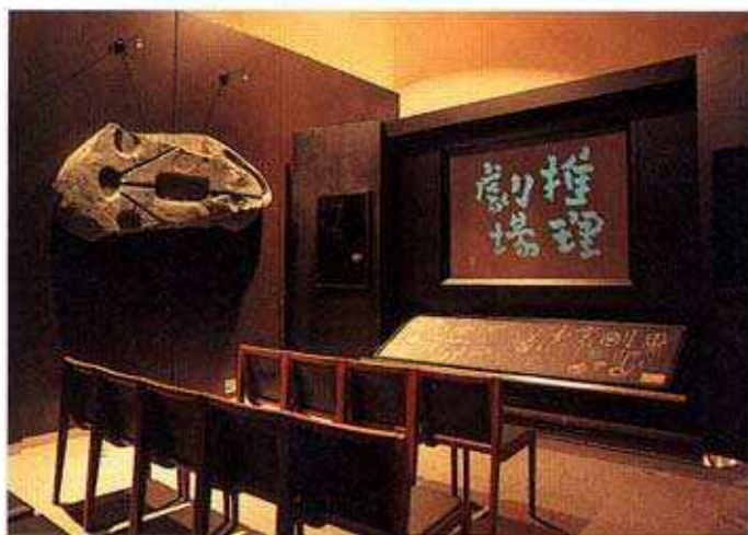
伎楽面▶ (大正時代の複製)