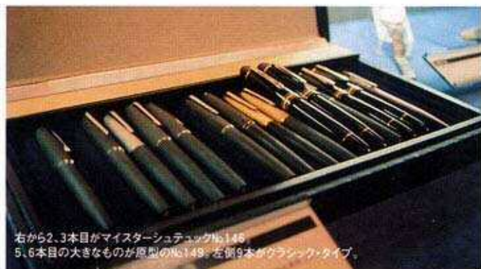
右から2、3本目がマイスターシュテックNo.148、5、6本目の大きなものが原型のNo.149。左側9本がクラシックタイプ。

これは、昭和四十九年の「文藝春秋」十二月号に掲載された「私の選んだベストブランド」という広告企画の中で、清張がモンブランを紹介した文章です。 実際、記念館に移した清張の書斎には、今でも数本のモンブランが引き出しの中に眠っていますし、ケースに展示している万年筆だけでも二十本あります。また、ペンが少しでもひっかかると取り替えてい