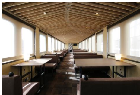
車両内観(4号車)イメージ