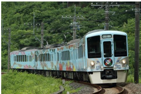
車両外観イメージ

2016年4月に運行を開始した「西武 旅するレストラン『52席の至福』」は、今年でデビュー5周年を迎えました。「西武・電車フェスタ 2021 in 武蔵丘車両検修場」では、デビュー5周年を記念して検修場内に留置されている「52席の至福」の車内にて、事前予約制で特別にカフェとして営業します。