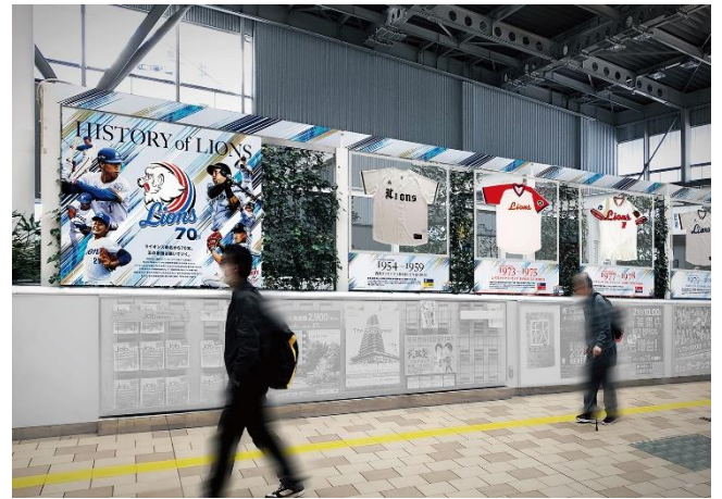
【西武球場前駅】 ※イメージ