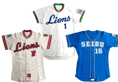
歴代ユニフォーム