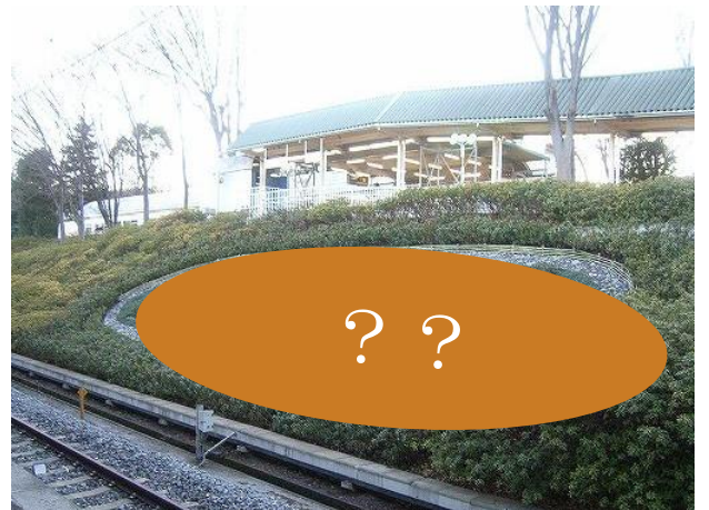
※過去に植栽アートを行っていた様子 (1番ホームのり面)