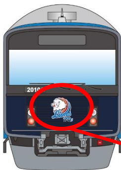
三代目「L-train」デザイン変更後イメージ