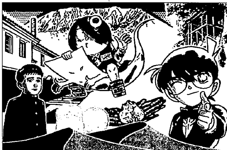
6色（6施設）重ね捺しスタンプの図柄