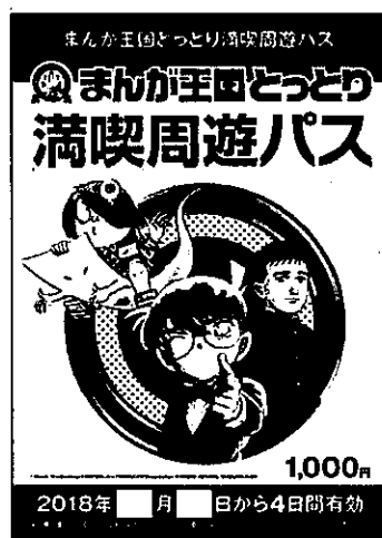
周遊ガイドブックを兼ねる パスの表紙（A5判）