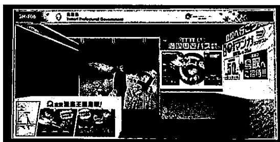
<鳥取県ブースイメージ図>

会場内のステージで鬼太郎君、コナン君とのじゃんけん大会や鳥取クイズ大会を実施し、「まんが王国とっとり」をPRする。