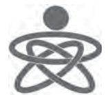
平成25年度 文化庁 地域発・文化芸術創造発信イニシアチブ