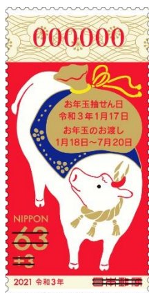
【寄付金付お年玉付年賀63円郵便切手】