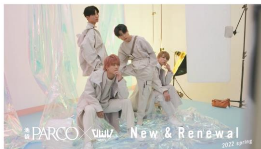
▲ キャンペーン第1弾メイキングムービー