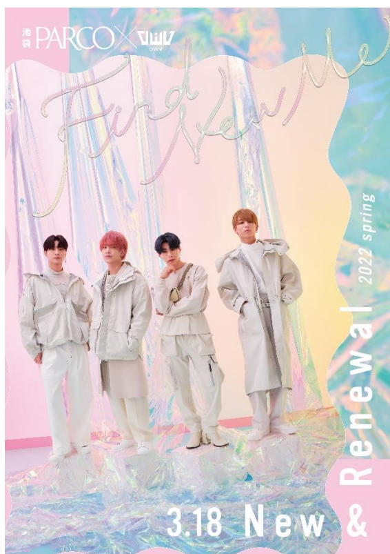
▲ キャンペーン第1弾メインポスター