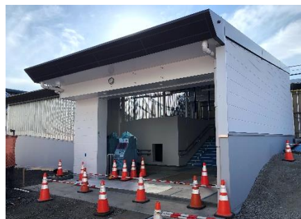
中央林間駅 東口改札 （左）完成イメージ （右）工事の様子

中央林間駅の改良工事は「鉄道駅総合改善事業」※として実施しており、お客さまの利便性・安全性を向上するための工事に、引き続き取り組んでまいります。