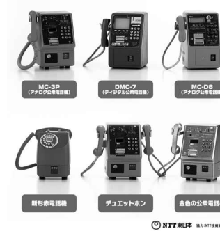
株式会社タカラトミーアーツ「ガチャ」 株式会社小学館「幼稚園」 (2019年)

災害時のインフラとしての公衆電話の重要性を再認識したという株式会社タカラトミーアーツの「ガチャ」の作成の監修を行いました。 また公衆電話の重要性に賛同いただいた株式会社小学館より「幼稚園」にて、公衆電話特集をしていただきました。