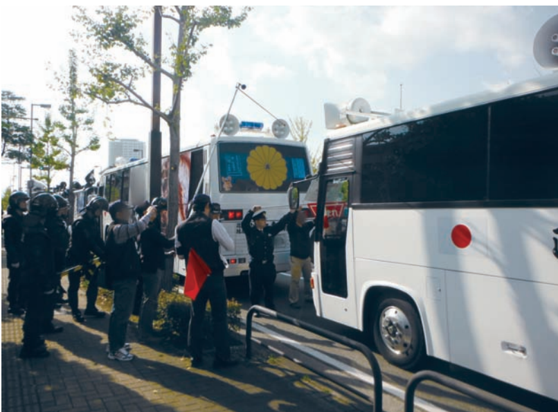
街頭宣伝活動に対する取締り（10月、福岡）

24年中の右翼による違法行為（右翼関係事件）の検挙件数・人員は、1,733件1,824人でしたが、これらの検挙事件のうち、資金獲得を目的とした恐喝事件等の悪質な犯罪の検挙は、349件408人に上り、道路交通法違反を除く全検挙件数（791件）の約44.1%を占め、悪質な資金源犯罪が依然として後を絶ちません。