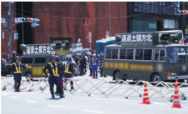
街頭宣伝活動を行う右翼団体（8月、東京）

一部の右翼は、街頭宣伝車を用いた大音量で執拗な街頭宣伝活動により、騒音被害や交通渋滞を引き起こすなど、市民生活の平穏を害しています。平成24年中、「糾弾街頭宣伝活動」