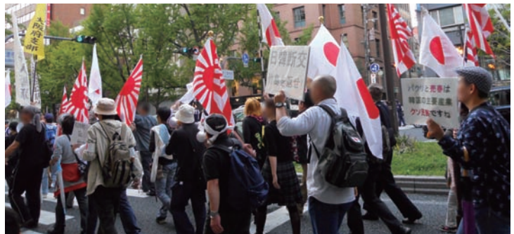
デモ行進を行う右派系市民グループ（10月、大阪）