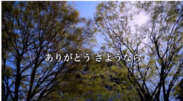
さよなら中野サンプラザクロージングムービー（リンクは以下の通り）

今後も事業者が立ち上げるエリアマネジメント協議会が事務局となり、中野独自の多様な文化と地元の声を活かして、地域の活性化につながる様々な活動を展開し、竣工後は、エリアマネジメント施設と屋上広場の一体的な運用を図り、文化・地域交流を促進することを目指します。