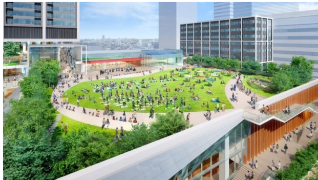
屋上広場イメージパース（今後変更になる可能性があります）