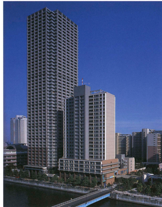
運河越しに2街区を見る Housing block seen across the canal.

株式会社 松村組 佐田建設株式会社 辻建設株式会社 古久根建設株式会社 共立建設株式会社 松井建設株式会社 林建設工業株式会社 京王建設株式会社 岩倉建設株式会社 竣工／2001年3月