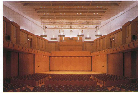
第一生命ホール Concert hall.