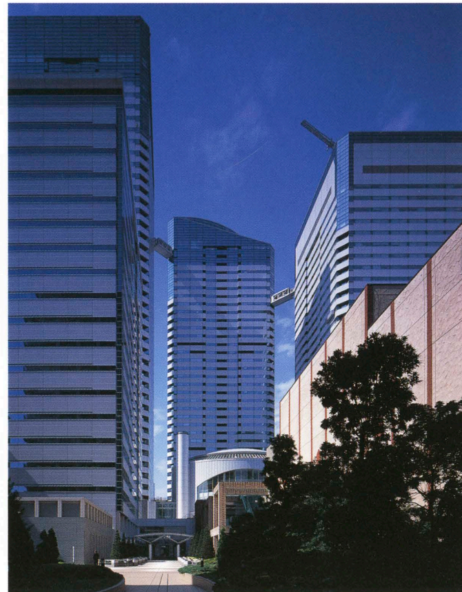
ふれあい通りよりオフィスタワー方向を見る Office towers seen from the pedestrian.

Location / Chuo-ku, Tokyo Owners / Urban Development Corporation Cooperative Association for Harumi 1-chome Urban Renewal Project