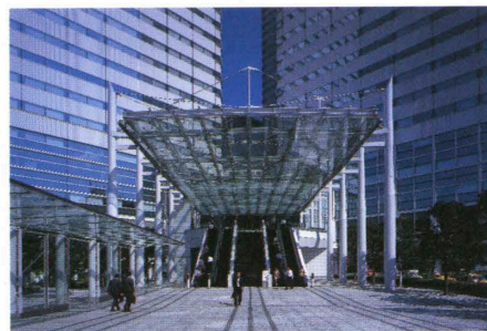
西側コーナーのエントランス Entrance to the office buildings.