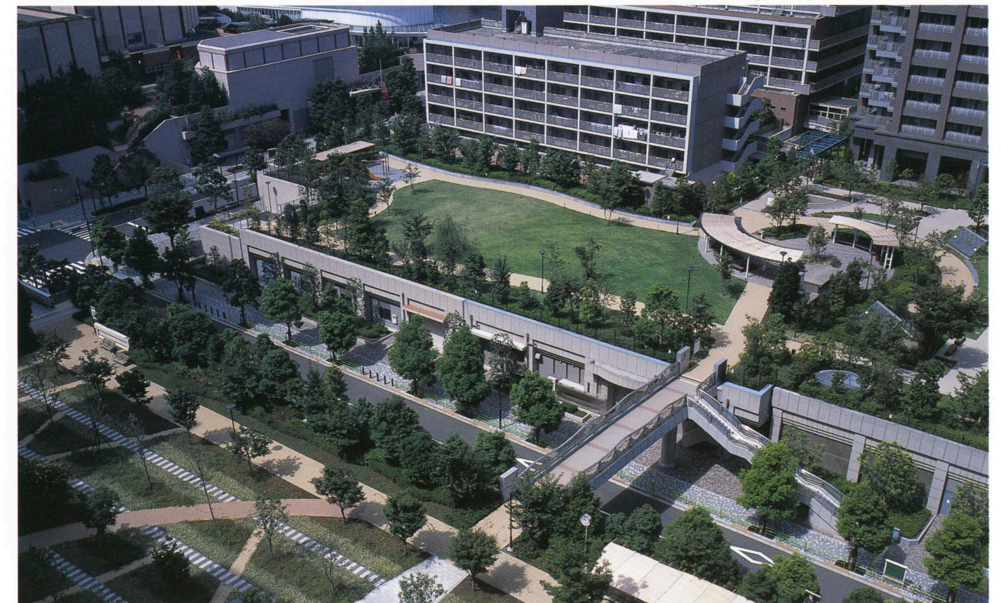
住居棟の間の広場を見下ろす Downward view of the greenery plaza between the highrise apartment towers and the others.