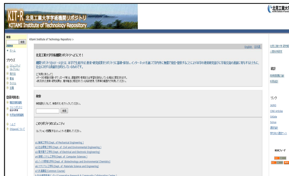
[DSpace運用時の本学リポジトリHP]