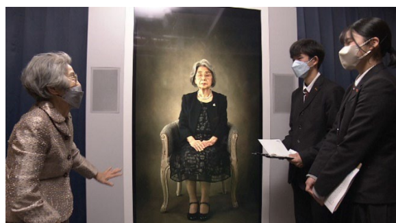
「永遠に語り継ぎたい ～未来に残す、あのときの記憶～」