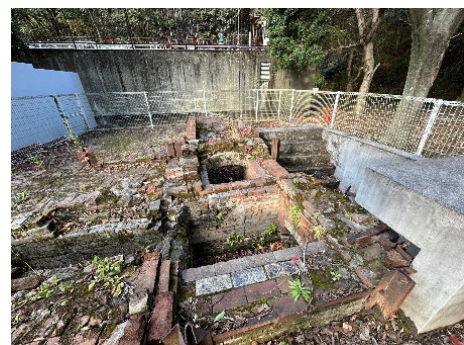
被爆者の遺体を火葬した 軍馬用の焼却炉の跡