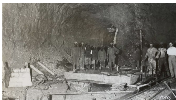
戦前のシンコロブエ鉱山