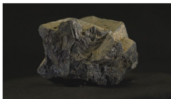
鉱山で採取されたウラン鉱石