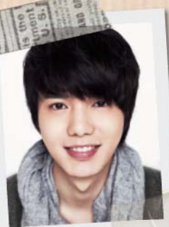
スキットに出演するのは… キム・シフ

今年度も、大人気の韓国出身の歌手グループ2PMが出演。4月には東京ドームコンサートも決定！今、もっとも“熱い”彼らがハングルを楽しく教えてください！