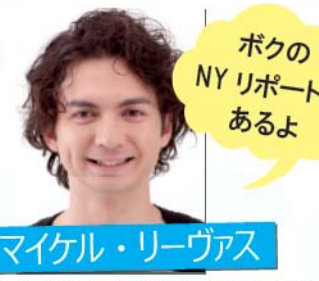
マイケル・リーヴァス