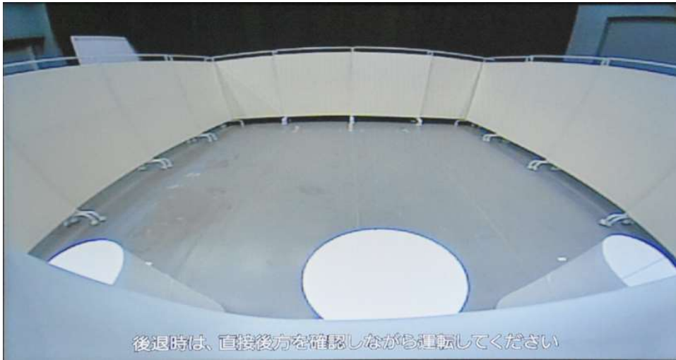
近接視界 Proximity field of vision