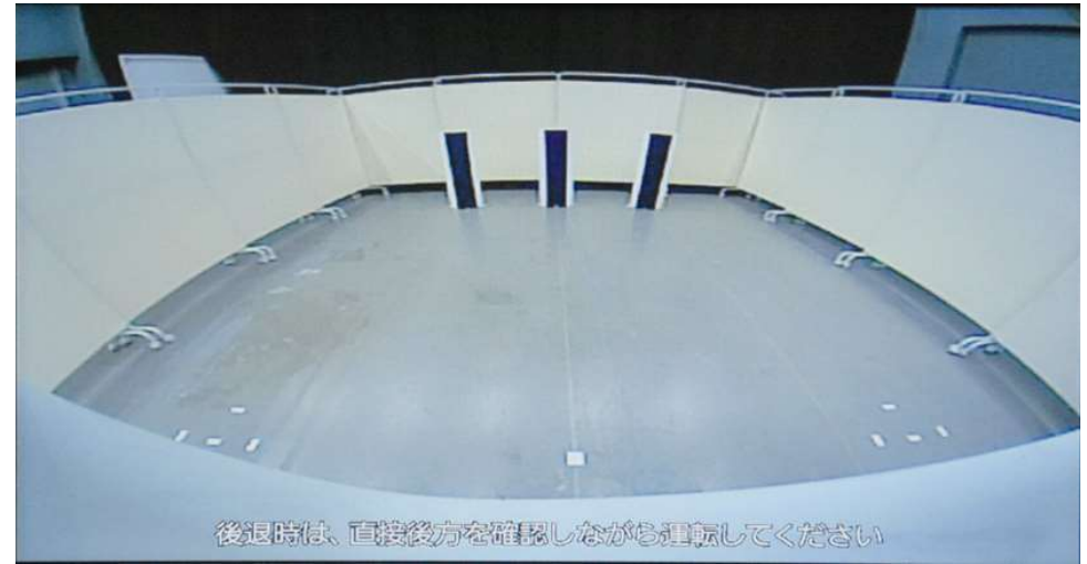
遠方視界 Distant field of vision