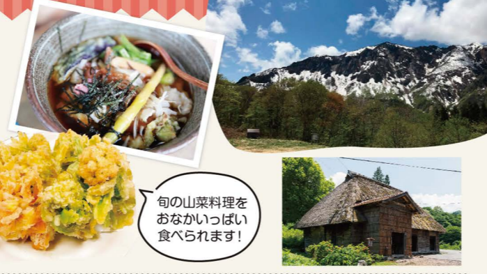
旬の山菜料理をおなかいっぱい食べられます!