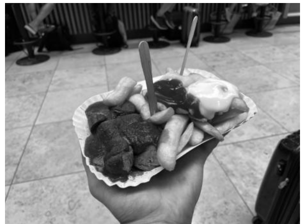
[写真2 (カレーブルスト)]

実は、ソーセージ以外にも定番のファストフードがドイツにはあります。それが、ケバブです。元々はトルコ料理ですが、トルコ系移民も数多く住んでいるからか、ベルリンではカレーブルストスタンド以上にケバブ屋を見かけるように思います。メルケル前首相が在任中しばしば訪れたというケバブ屋もあるなど、ケバブはドイツの生活にしっかりと根付いた料理となっています。