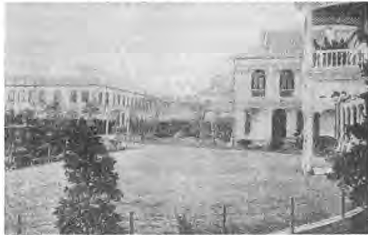
大蔵省庁舎の全景、右端の建物が支関、その左2階建の建物に大蔵御室があり、その左側の建物が各局である。

会計局は14年6月27日、省中のいっさいの会計、諸般の需要及び物品等に関する事務を管掌する局として設置された。同局には調査、用度、計算の各部と営繕、庶務の各掛が置かれた。15年1月17日職制ならびに事務章程を改め、同局は省中いっさいの会計を管掌し、本省用所属の地所、家屋、財産、物品を管守弁給し、その他省内取締上に関する事務を管掌することとした。これに伴っ