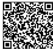
第3後方支援連隊HP QRコード

https://www.mod.go.jp/gsdf/mae/3d/3log/index.html