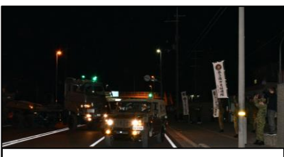
今津駐屯地に向け出発

令和5年3月、第3戦車大隊及び第3偵察隊の廃止に伴い、戦車直接支援隊及び偵察直接支援小隊が廃止された。平成18年の新編以来、各部隊を密接に支援し、ここに17年の歴史に幕を閉じた。 また、輸送隊第3輸送小隊は、セミトレーラにより戦車輸送等を実施してきたが、第3戦車大隊廃止に伴い、こちらも30年間の輸送支援を終え廃止となった。 また、偵察戦闘大隊の新編に伴い、新たに偵察戦闘直接支援隊が今津駐屯地に新設された。これまでと同様、密接な支援を行い、新たに伝統を築いていくこととなる。