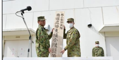
偵察支援小隊廃止式