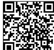
第3後方支援連隊Twitter QRコード