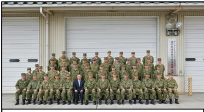
偵察戦闘大隊編成完結記念